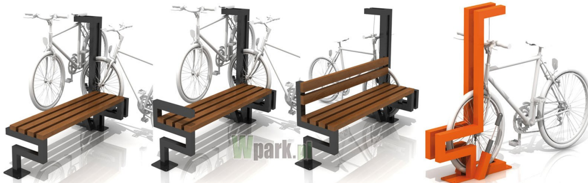
BIKESTOP połączone z ławkami